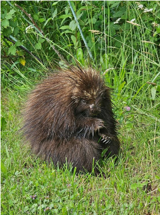
Figure 1 Maman porc-épic