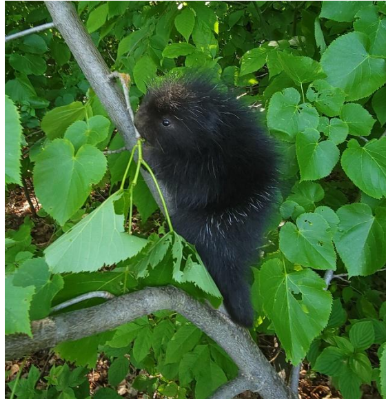
Figure 2 Bébé porc-épic né au printemps